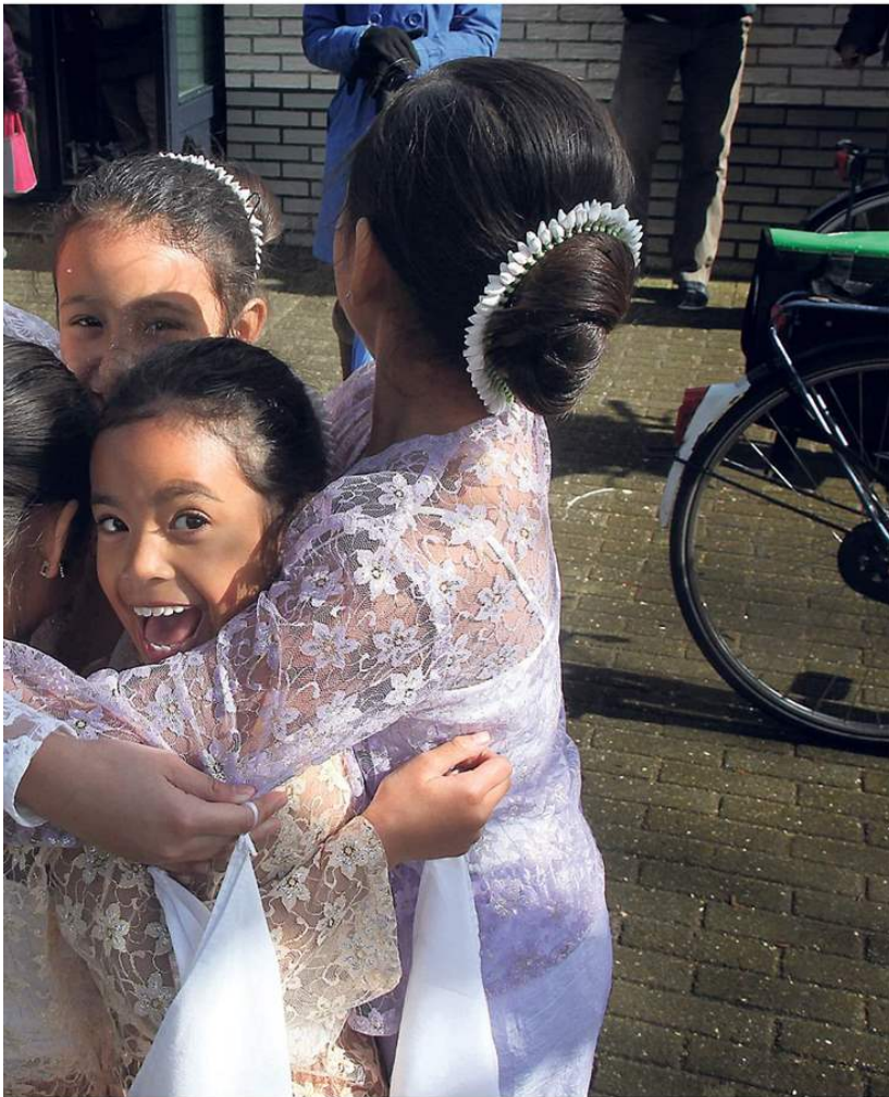
te generatie 'Huizer' Molukkers, maart 2014.