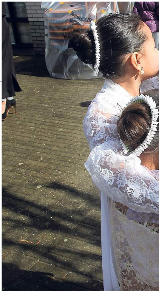
Fest bij de onthulling van het monument - aan de Gemeenlandsaan - voor de eer